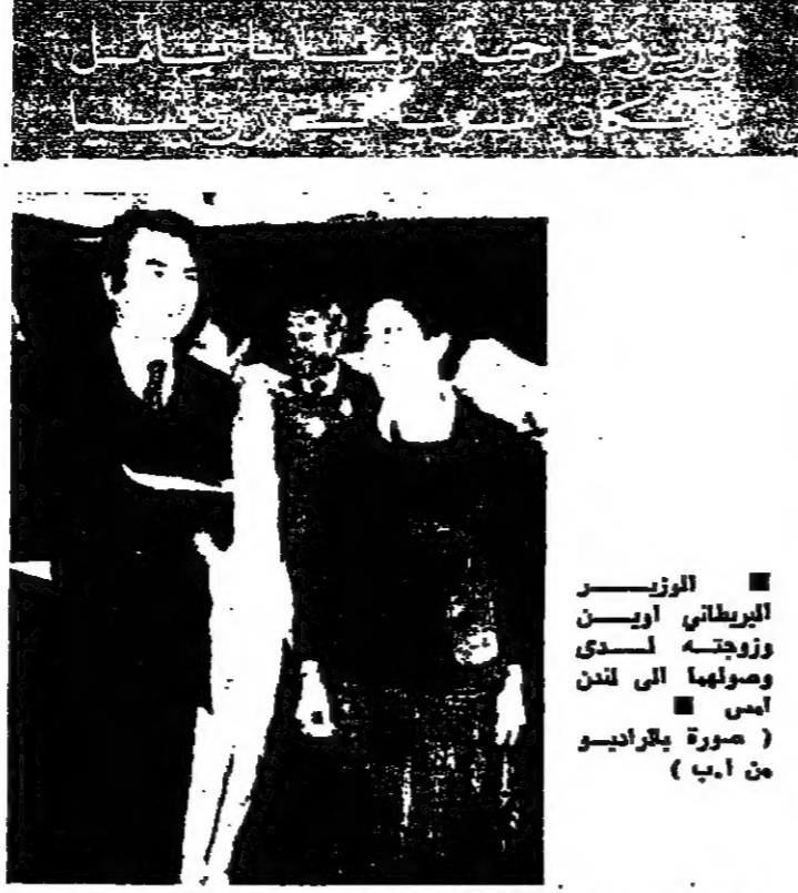
الوزير البريطاني ايرين وروجره لسيدي وصولها الى لندن أمس

اعلان السيد نو القطار علي بوتو رئيس وزراء باكستان ان لا نية لديه بالاستقالة لانها المنه السياسي في باكستان . وبلغ السيد بوتو ( ٤٩ سنة ) مؤتمرا صحفيا فلكه انه لن يتردد في العمل ضد الجيش اذا مارس اي ضغط عليه . واعلان في محاولة يبدو انها تصفالي اتزان عدم من مبادئ المعارضين الذين يقفون خلف تحريض الجاهل المغاضبة ضد حكومة حذرا على الحضور والمسير والنواحي القبلية في باكستان . وقال السيد بوتو مجتمعا بالصحفيين ١٠٠ دقيقة للبحث في موجة غضب ضد حكومته تتجاذع البلاد حاليا وتكسر فيها اكثر من ١٧٠ شخصا حتى الآن . وتنادي المعارضة باستقالة السيد بوتو وتهمه بالانحياز في الانتخابات العامة التي جرت في ٧ آذار الماضي ، وقال فيها حزب الشعب الذي يتزعمها نضرا كسحا للاحتفاظ بالسلطة . وتساءل السيد بوتو بوجهة في مؤتمره الصحفي قائلا : لماذا ينبغي ان استقيل . لقد اعيد انتخابي بصورتهم ودية وسياسية ومفوية لاكون رئيسا للوزراء . اني لم اغضب من منضي . لاهور - ر